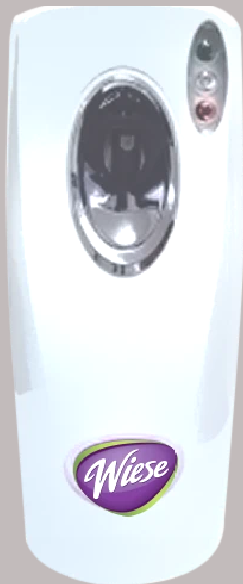
DISPENSADOR DE AEROSOL PROGRAMABLE DC